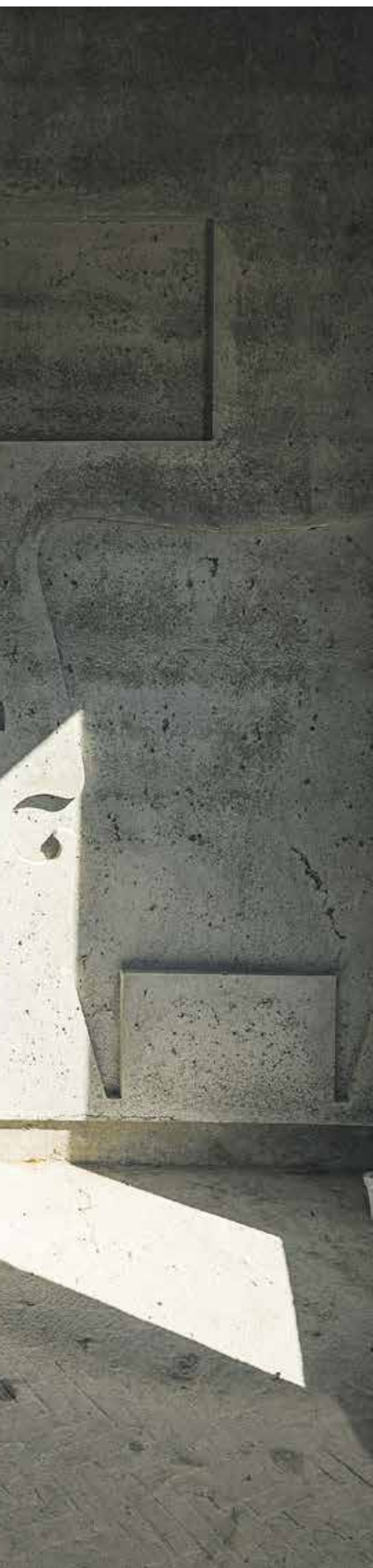
eln, von Einrichtung, von zerstörtem Leben