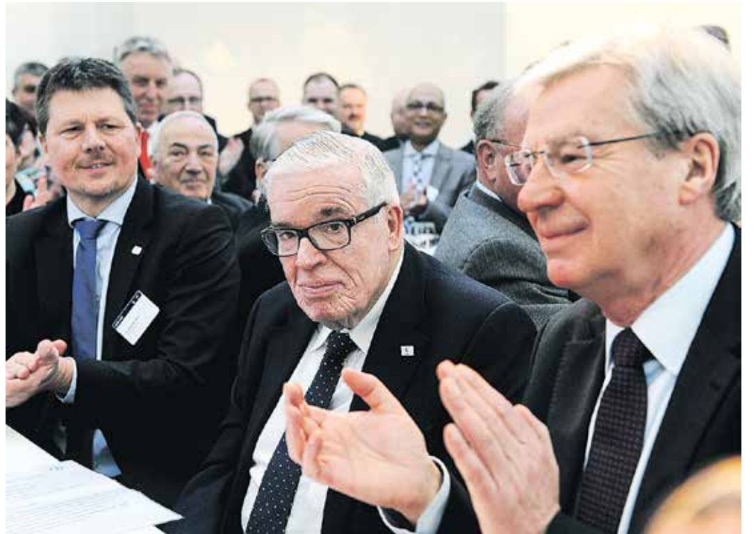
Reichster Einwohner der Schweiz und Mehrheitsaktionär bei Kühne + Nagel: Klaus-Michael Kühne

Materiellen Hinterlassenschaften kommt, angesichts des nahenden Lebensendes der letzten Zeitzeug:innen, ebenfalls eine neue Rolle zu. 78 Jahre nach dem Holocaust übernehmen Dinge die Funktion von Präsenz, von unmittelbarer und emotionaler Zugänglichkeit. Das Fehlen solcher Erinnerungsstücke in jüdischen Fami-