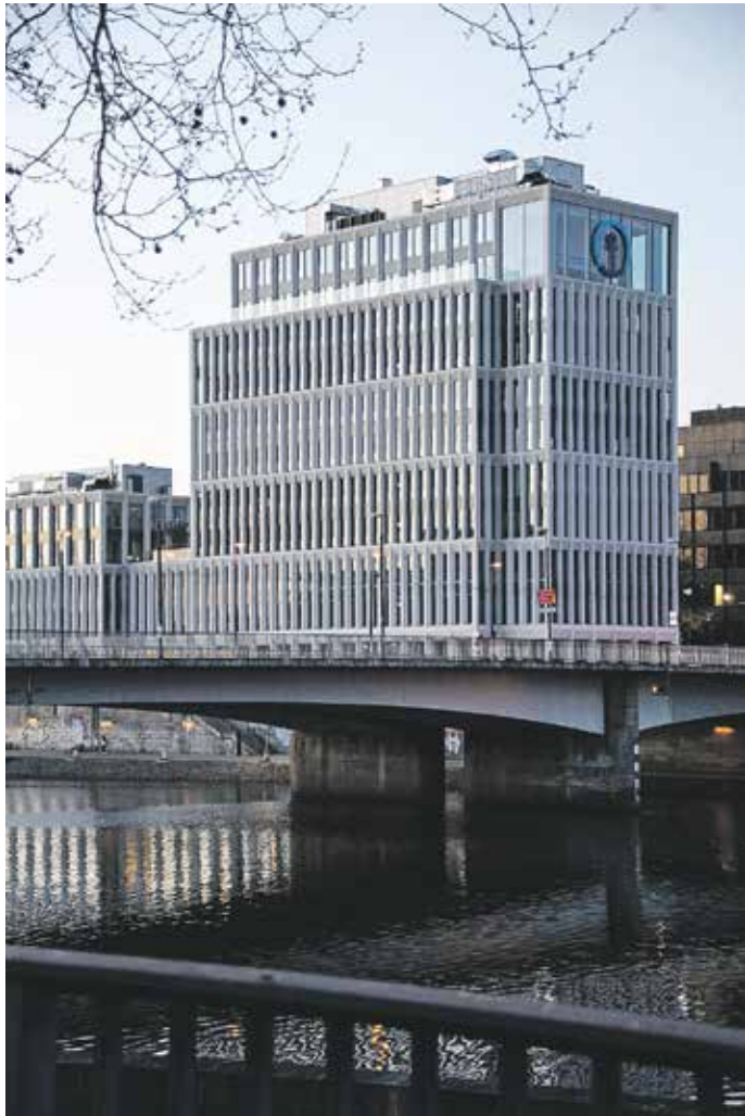
Die neue Deutschlandzentrale von Kühne + Nagel in Bremen.

dienstkreuz. Auch bei Kühne + Nagel soll es Prämien für Hinweise auf jüdische Wohnungen gegeben haben. Im besetzten Amsterdam wird das Raubgut auf Binnenschiffe verladen, zum Beispiel auf die „Damco 48“. Im Landesarchiv Oldenburg befindet sich ihre Ladeliste, die alphabetisch erfasst, was zwischen dem 9. und dem 13. März 1943 an Bord geschafft wird. Es gibt Hunderte solcher Listen – diese sei hier beispielhaft zitiert: „53 Badewannen, 61 Bänke, 27 Bessen, 71 Bettgestelle, 71 Stück Bettzeug, 65 Rollen Bodenbelag, 56 Buffets, 15 Bügelbretter, 14 Eimer, 69 Gartentische, 1 Gasherd, 11 Gaskocher, 9 Gasöfen, 20 Herde, 1 Kinderwagen, 101 Kissen, 63 Klubsessel, 6 Kohlenküppen, 80 Lampen, 45 Nachtschränken, 6 Nähkörbchen, 12 Nähmaschinen, 3 Petroleumkocher, 148 Schränke, 16 Spiegel, 103 Spiralen, 53 Ständer, 1 Staubsauger, 600 Stühle, 46 Teemöbel, 170 Teppiche, 195 Tische, 53 Trittleitern, 1 Uhr, 4 Mahane, 10 Waschkessel, 148 Wandbilder, 1 Möbelschrank mit Töpfen und Bratpfannen“. Die „Damco 48“ hat eine Traglast von 614 Tonnen, sie fährt unter der Flagge von Kühne + Nagel. Auch die Ladeliste trägt den Firmenstempel. Eine Woche vor der Beladung beginnt die Deportation der jüdischen Amsterdamer:innen vom KZ Westerbork ins Vernichtungslager Sobibor. Möglich, dass auch der Besitz der Fa-